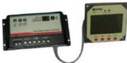
Collegamento del display

Il display remoto è un accessorio opzionale acquistabile a parte. Sul display remoto è possibile monitorare in ogni istante la tensione delle batterie, la potenza erogata dal pannello e lo stato di alimentazione. Ogni malfunzionamento viene segnalato tramite apposita spia. Con il display viene fornito un cavo di collegamento di 10 metri.